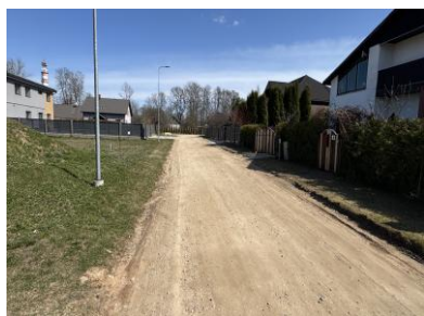
Apkārtne, piebraucamais ceļš.